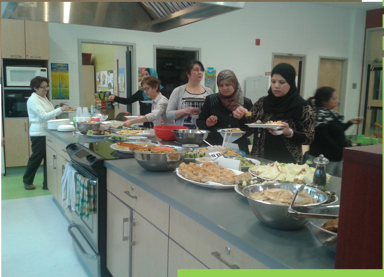
Repas communautaire Douceurs du monde , activité de sensibilisation dans le cadre de la Semaine d'actions contre le racisme.