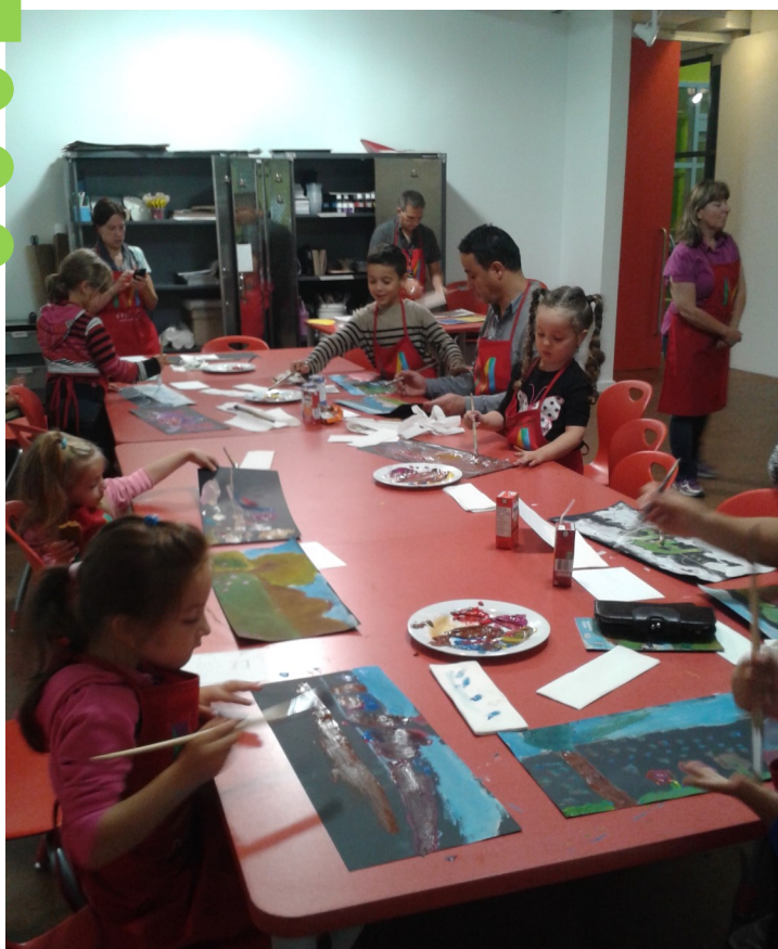
Sortie au Musée des Beaux-Arts