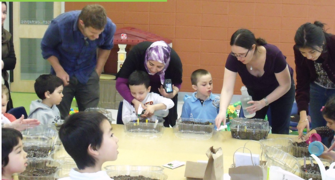
Jardinage et semis avec Ville-en-Vert