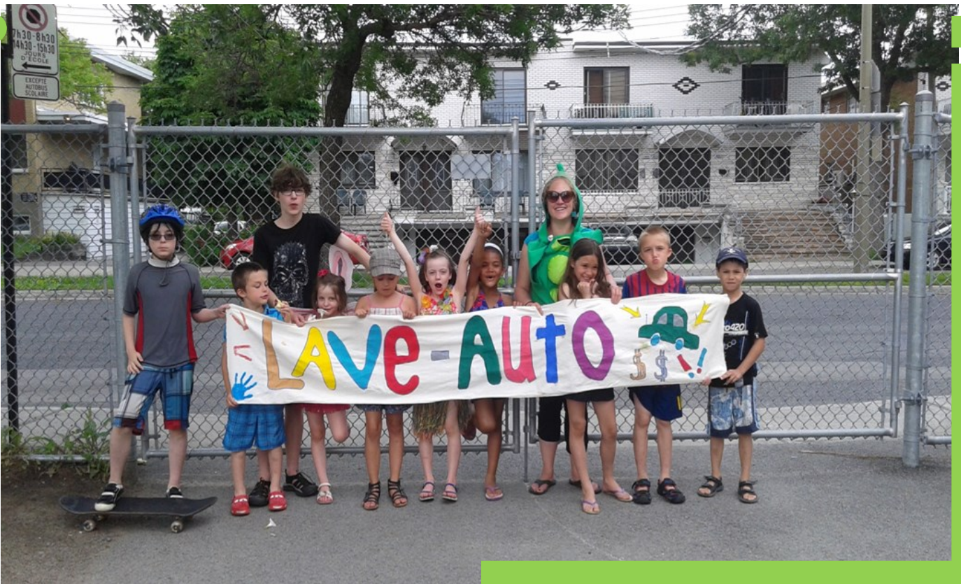
Lave-auto dans la cour d'école de Saints-Martyrs-Canadiens pour financer le camp familial au Domaine du Lac Bleu.