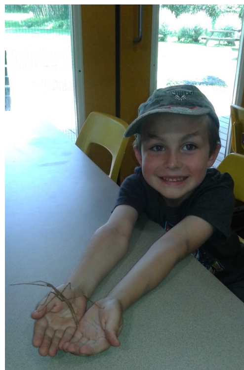
Sortie au Parc nature de la Pointe-aux- Prairies