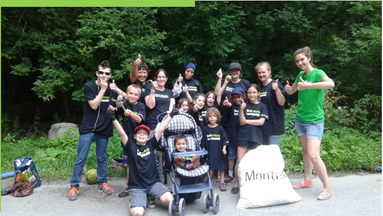
Corvée nettoyage au Parc de l'Île de La Visitation en partenariat avec la Ville de Montréal et l'organisme Ville en Vert.